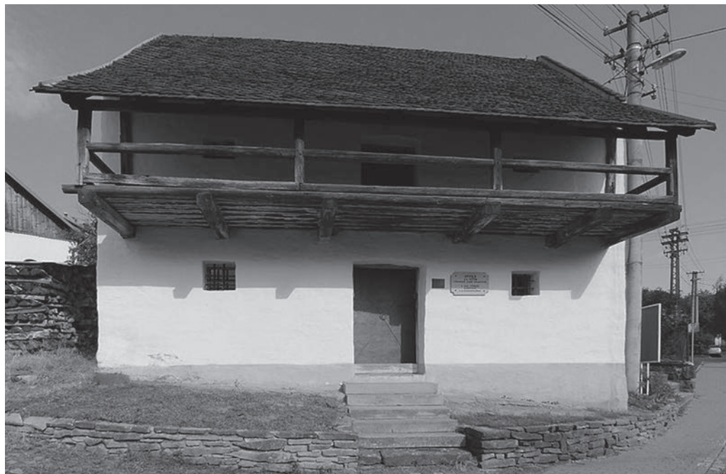
Dům v jihomoravské obci Komňa, kde byl Komenského děd fojtem, je některými považovaný za Komenského rodný dům. Skutečné rodiště Učitele národů není zcela jisté, ale s největší pravděpodobností jím byla Nivnice.

Přistupme ke druhému okruhu Komenského projektu emendace lidských věcí, totiž k nastolení náboženského míru. Tato problematika byla v 17. století zvláště aktuální, když jedním ze základních motivů, především hrůzně třicetileté války (1618–1648), byl konflikt mezi katolicismem a protestantismem propojený téměř neoddelitelně s ekonomickými a politickými ambicemi mocenských elit tehdy nejmocnějších evropských států. Na jedné straně těch, v nichž vládli Habsburkové a s nimi spojení vladaři, zvláště v jižním Německu, a na straně druhé především Nizozemí, Dánsko, Švédsko a později též Francie (ač katolická!). Jak však ukazuje žhavá současnost, náboženská víra (především ve svých militantních formách) nepřestala být důvodem k sociálním a politickým konfliktům, jak jsem o tom ostatně psal v minulém čísle Tvůrčího života v článku o světovém étosu Hanse Künga.